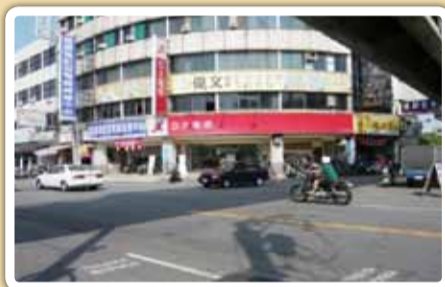
危險路口1：八德街與林森路