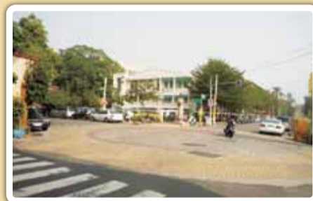
危險路口2：長春路與文化路